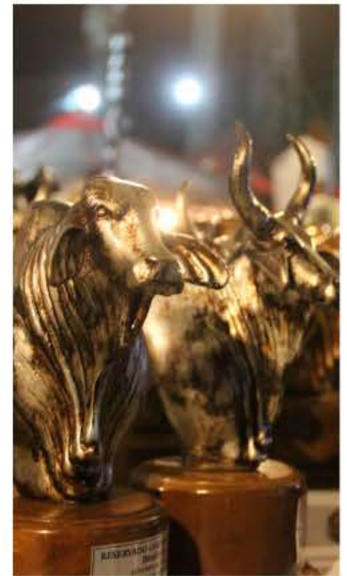
Esta importante Feria Ganadera tiene como fin presentar a la población aragüeña los mejores exponentes de la ganadería nacional

> Todo el potencial productivo, pecuario y agrícola se dará cita, organizado por el Ministerio de Agricultura y Tierras y Asocebu, con el apoyo de la Gobernación de Aragua y la Alcaldía de Girardot, y la participación de ganaderos del país