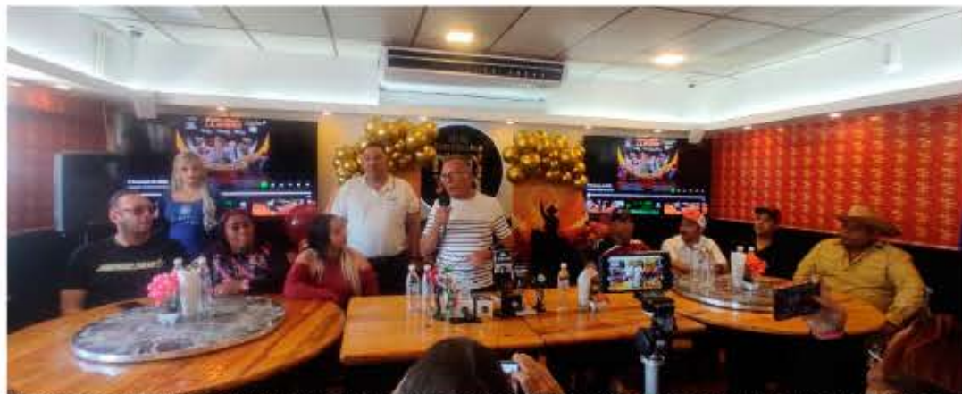
Osisteconsa y la Fundación Viva Venezuela son los patrocinadores oficiales y aseguraron que esta velada es imperdible para los amantes del llano

La información la dieron a conocer a través de una rueda de prensa los organizadores del evento, que definitivamente