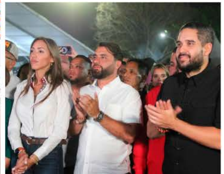
La 46ª Feria Nacional del Cebú también será vitrina de 80 expositores comerciales nacionales, regionales