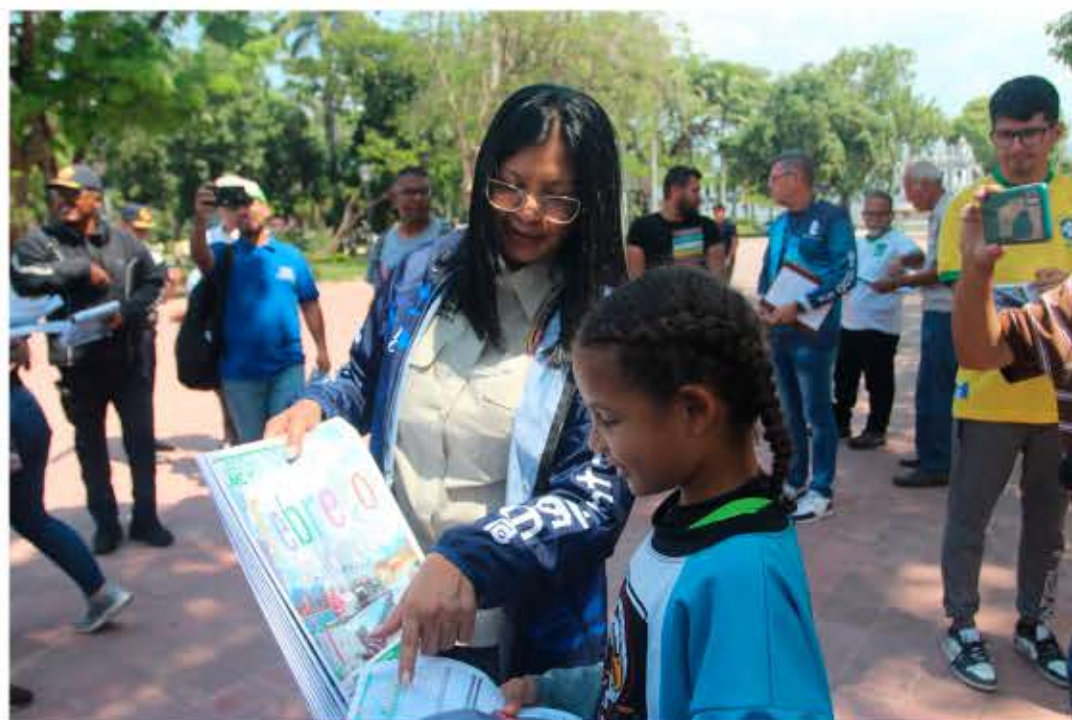
Gobernadora Carpio, realizando entrega del diario Ciudad Maracay

El ciclo de entrevistas dio inicio en el espacio radial Cronómetro Deportivo, siendo el presidente del Instituto de Deporte del estado Ara-