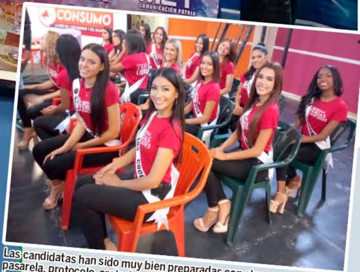
Las candidatas han sido muy bien preparadas con clases como pasarela, protocolo, oratoria y dicción entre otras que hacen formar a las participantes de manera integral.

> Este año el evento contará con un himno por primera vez en la historia, donde se dará a conocer en la noche final del concurso