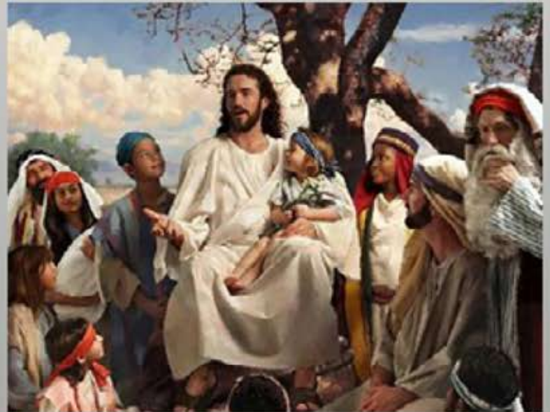
Jesús de Nazaret, hombre cargado de fe y esperanza, hijo de Dios y de María por obra y gracias del Espíritu Santo

Este acontecimiento es el fundamento de la celebración de la pascua y la sagrada comu-