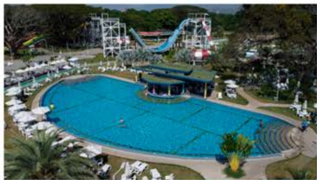
GABRIELA MARACARA CIUDAD MCY

Durante las celebraciones de Semana Santa, la ciudad de Maracay cuenta con espacios para el disfrute de toda familia, desde playas, plazas, montañas, etc., pero sobre todo lo que más ha resaltado durante las pasadas festividades son sus parques de atracciones, los cuales han sido la estrella durante los asuetos.