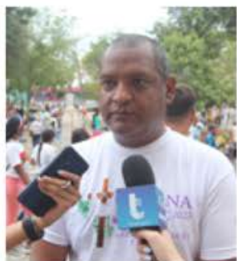
REINA BETANCOURT | CIUDAD MCY

Bajo un ambiente lleno de mucha fe más de 20 mil devotos del municipio Ezequiel Zamora de Aragua y de toda Venezuela, desbordados con diferentes manifestaciones de devoción caminaron por las calles de Villa de Cura, acompañando la procesión del Santo Sepulcro, para agradecer al Santo por los milagros cumplidos, y hacer nuevas peticiones de salud, guía y protección.