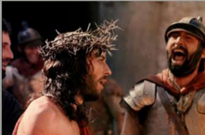
Fue llevado a la cruz para ser crucificado, por declararse ser el Mesías, el Hijo de Dios

nión o eucaristía, en la cual se recuerda el memorial de la pasión, muerte y resurrección de Jesús. La centralidad de la resurrección en el pensamiento cristiano le dio su nombre actual al día domingo en las lenguas latinas. Domingo quiere decir, así, día del Señor.