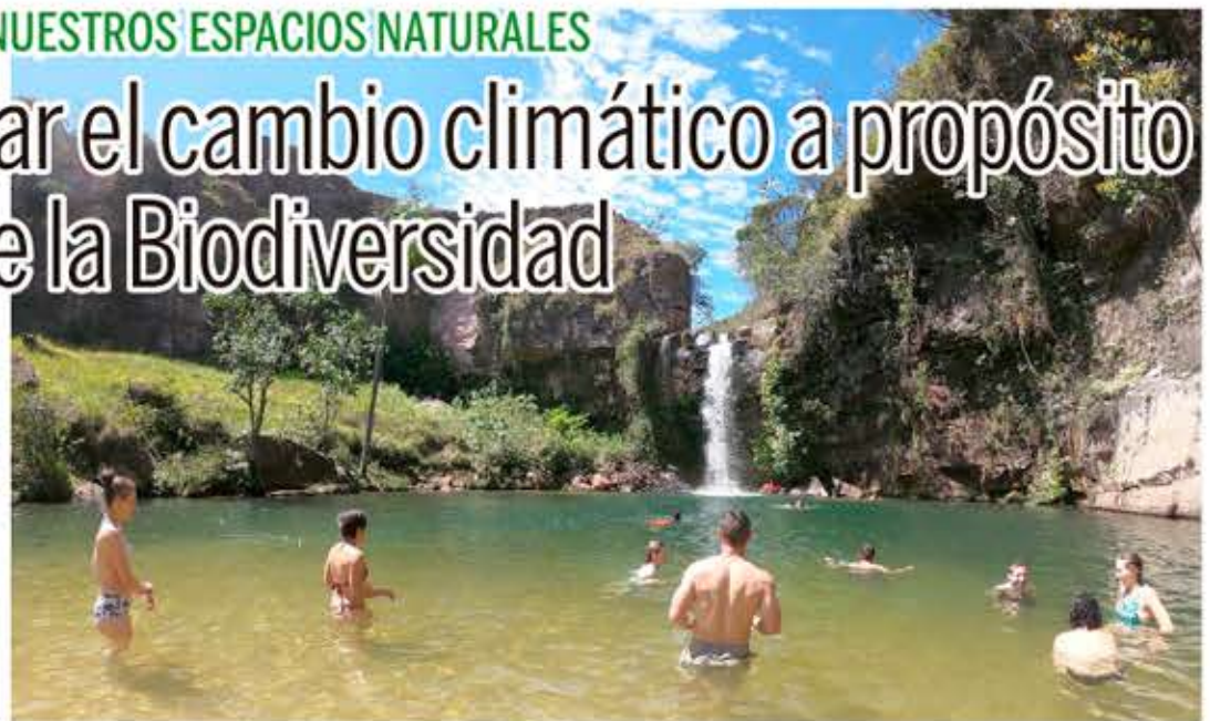
El Día Internacional de la Diversidad Biológica nos recuerda que debemos proteger nuestros espacios naturales

Por su parte, el canciller de la República, Yván Gil, manifestó en la misma red social: "Todos los 22 de mayo, Día Internacional de la Diversidad Biológica, es preciso recordar siempre que