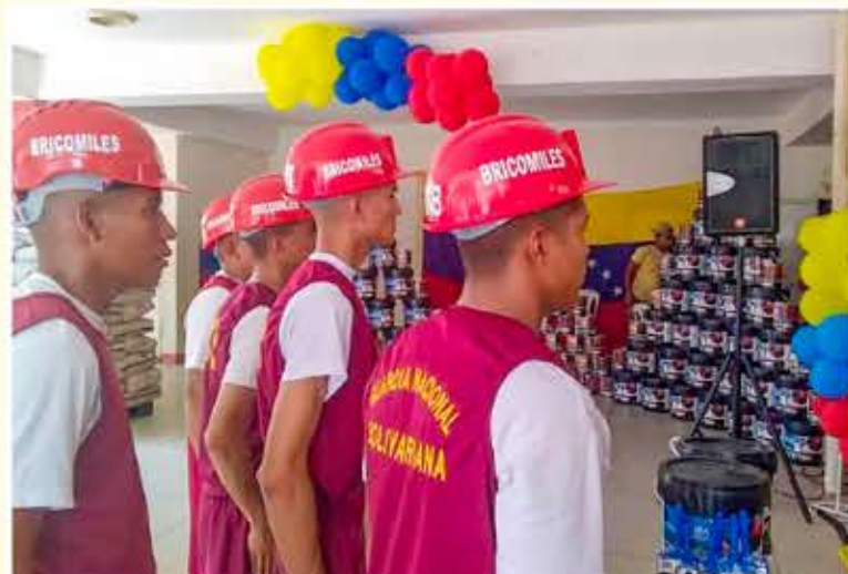
La recuperación incluye instalaciones eléctricas, trabajos de albañilería, entre otros

Del mismo modo, destacó el ímpetu y motivación de los miembros de la Fuerza Armada Nacional Bolivariana (FANB). "Tienen un gran corazón, una gran voluntad y una gran motivación para salir al frente a constituir, a operar, y a avanzar con las brigadas comunitarias militares para la salud y para la educación", aseveró.