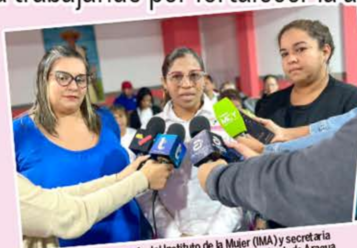
Gladys Torrealba, presidenta del Instituto de la Mujer (IMA) y secretaria sectorial de Asuntos de la Mujer e Igualdad de Género del estado Aragua

destacó que han atendido a 2 mil 602 mujeres y 549 hombres, generando así un total de 3 mil 151 atenciones pertenecientes a los diferentes municipios.