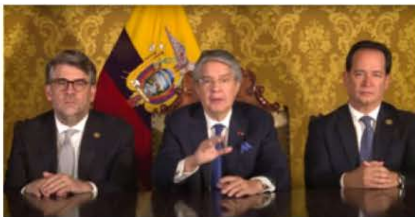
Con la firma de este decreto Guillermo Lasso crea una Consejería de Gobierno para reforzar su gabinete