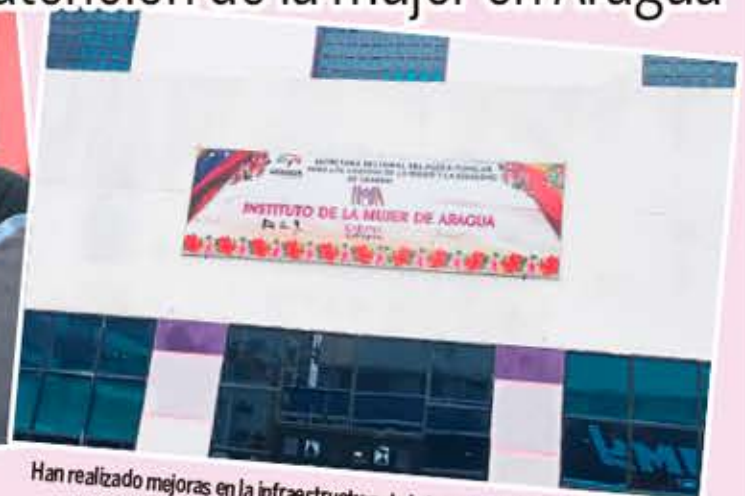
Han realizado mejoras en la infraestructura de la Institución