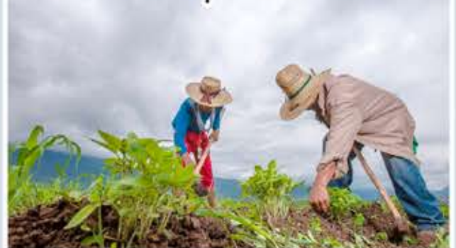
La Feria tiene la finalidad de dar a conocer una gran variedad de actividades agrícolas, turísticas, deportivas y culturales de la región larense

Es por esto que la locación y el nombre de la Primera Feria Agroturística Juan Jacinto Lara también pretende rendir un merecido homenaje y conmemorar el nacimiento de tan importante personaje para la historia, tanto de Venezuela como del estado Lara.