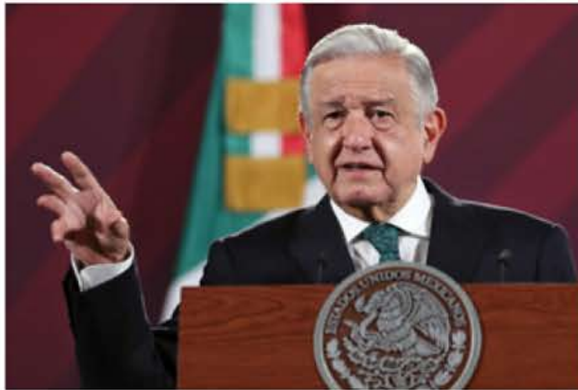
El presidente mexicano presentará una propuesta de otorgamiento de visas temporales de trabajo a centroamericanos

Explicó que las obras del sureste avanzan y la idea es integrar a toda la región, no solamente con el Tren Maya y el Interoceánico, sino toda la demás