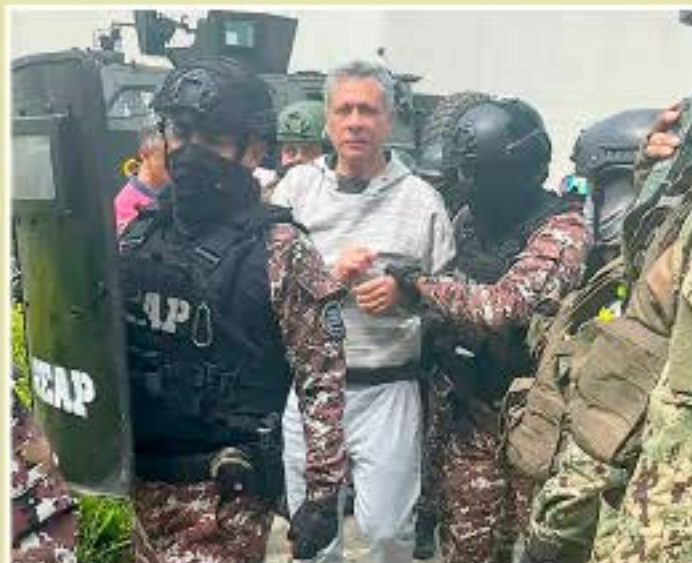
Glas fue secuestrado por fuerzas de seguridad ecuatorianas que asaltaron la Embajada de México en Quito

Países latinoamericanos como Brasil, Colombia, Venezuela, Chile, Argentina, Uruguay, Perú y Cuba, entre otros, repudiaron el asalto que culminó con la detención por la fuerza del vicepresidente Glas, requerido por la justicia ecuatoriana por cargos de corrupción, aunque para México era un asilado.