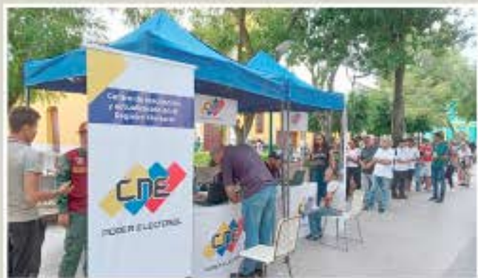
Las actividades cumplidas del cronograma electoral alcanzan un 27%, llevando el 13% de las establecidas FOTO CO

En el acto de escogencia de posición en el instrumento de votación estuvieron presentes los rectores del CNE, los representantes de los partidos políticos y varios de los candidatos presidenciales.