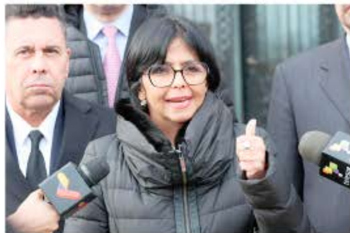
La vicepresidenta de Venezuela, junto a una comisión legal del país, entregó documento para defender la verdad histórica sobre el Esequibo

La vicepresidenta Ejecutiva de la República, Delcy Rodríguez, entregó ante la Corte Internacional de Justicia en La Haya, Holanda, un documento con las evidencias que demuestran que Venezuela es la única nación con el título sobre el territorio de la Guayana Esequiba y además ratificó