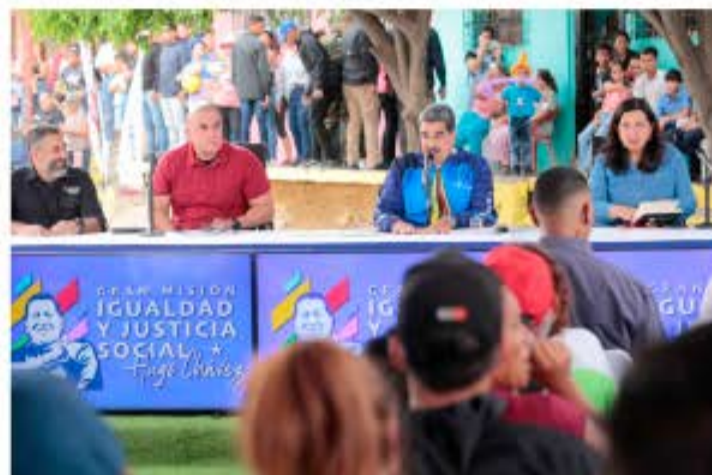
Maduro ofreció un balance de la Consulta Popular Nacional 2024, a fin de constatar los logros del Poder Popular organizado.

En este sentido reiteró su propuesta para que la Consulta Popular Nacional sobre los pro-