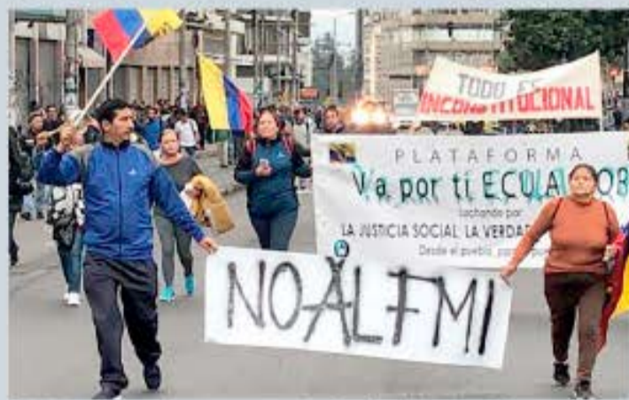
Este tipo de acuerdos comprometen al país solicitante, al hacer reformas que repercuten en la disconformidad social

El Gobierno ecuatoriano alcanzó un acuerdo técnico con el Fondo Monetario Internacional (FMI) para un nuevo crédito por 4 mil millones de dólares, a un plazo de cuatro años, según un comunicado difundido por medios locales de este país andino.