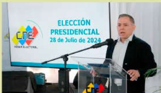
Quintero: El Plan del CNE cuenta con 12 auditorías que se realizarán antes de los comicios