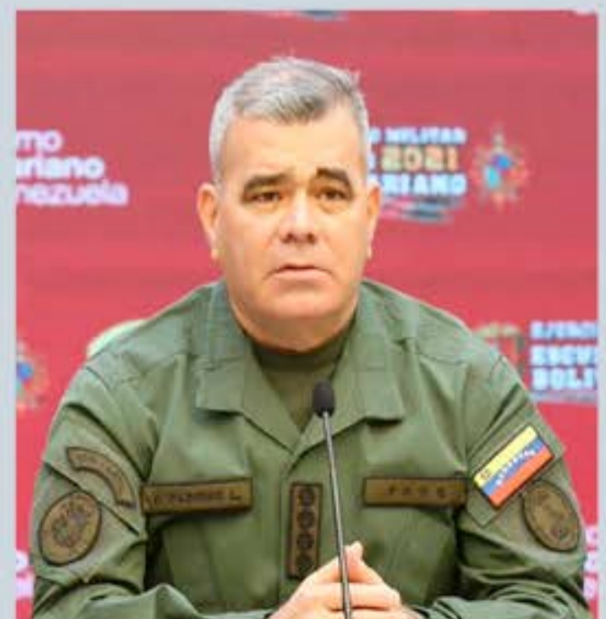
Vladimir Padrino López, ministro del Poder Popular para la Defensa. FOTO: REFERENCIAL

Ante las pretensiones de Guyana y empresas transnacionales de explotar un territorio en disputa, Venezuela ha ratificado su legítima reclamación sobre la Guayana Esequiba sujeta al Acuerdo de Ginebra del 17 de febrero de 1966.