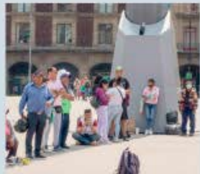
La avería se podría deber a una ola de calor que afecta al país y provoca una alta demanda de energía

> Las altas temperaturas han azotado al país en las últimas semanas y en algunos puntos del norte mexicano se ha alcanzado hasta más de 45 grados centígrados