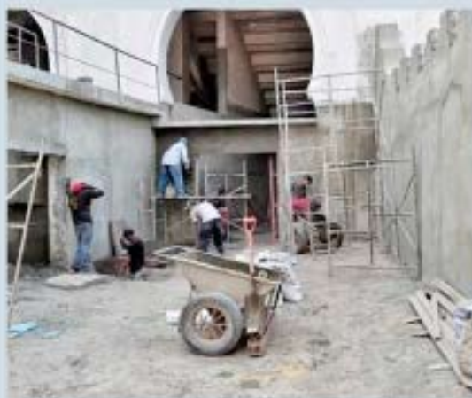
IRENE RODRÍGUEZ (PASANTE) CIUDAD MCY

> Se aprecian avances en los trabajos de rehabilitación del antiguo coso taurino callicantino