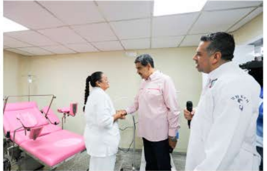
En los próximos días, el presidente Maduro se reunirá con los 4 mil 500 Circuitos Comunales para la entrega de recursos

Este 7 de mayo, durante una jornada de trabajo sobre los avances de las Bricomiles, reiteró que en perfecta unión cívico - militar, a través del Sistema 1x10 del Buen Gobierno, se recupera-