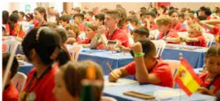
Durante la competencia, cada participante tuvo que resolver 70 operaciones aritméticas en menos de cinco minutos

"Felicidades a ustedes, a sus maestros, entrenadores y muy especialmente a las familias, madres y padres, quienes amorosamente cultivan valores y conocimientos", publicó el Ministerio para Ciencia y Tecnología.