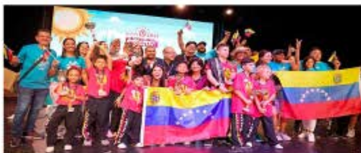
Venezuela brilló en Campeonato Mundial de Cálculo Mental, en España