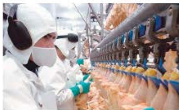
La industria brasileña garantiza la transparencia del servicio de comercio de aves de corral entre los países importadores FOTOREGIONAMERICANA

Entre los productos que podrían caer bajo restricciones figuran la carne de aves de corral, la carne fresca de aves de corral y sus derivados, huevos, carne para alimentación animal, materias primas de