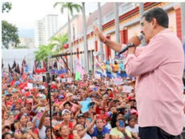
La red social se ha incitado al odio y a la violencia contra las autoridades del Gobierno, policías y militares

"10 días para que presenten sus recaudos y para establecer la medida administrativa definitiva, pero ya basta, ya basta de tratar de sembrar la violencia, el odio, ya basta de tratar de atacar a Venezuela desde el exterior. Tenemos que derrotar el golpe de Estado cibernético fascista y criminal", agregó.