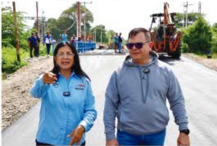
THAIMARA ORTIZ | IRENE RODRÍGUEZ | CIUDAD MCY FOTOS | ANA MONTAGNE

> Las acciones de recuperación están enfocadas en garantizar el bienestar y seguridad del pueblo sucrense