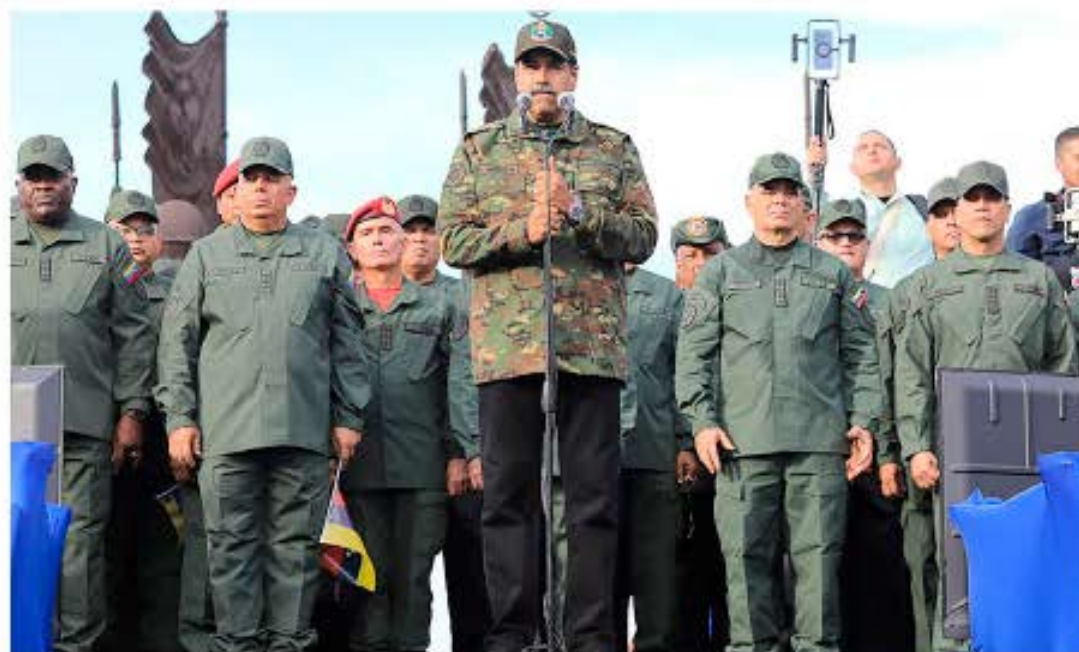
El Presidente exigió al Estado Mayor de la FANB que garantice la celeridad, eficiencia y justicia severa

> "El gran reto es ganar la batalla de la verdad de Venezuela en el mundo", dijo el dignatario nacional