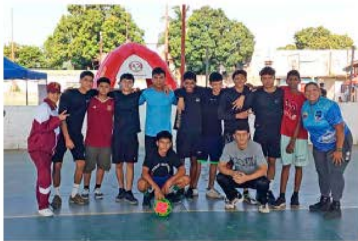
CIUDAD MCY | PRENSA SENADES ARAGUA

Como parte de la Semana Internacional del Desarme el Servicio Nacional para el Desarme (Senades) en el estado Aragua organizó una jornada recreativa, cultural y deportiva denominada «La Paz es el camino».