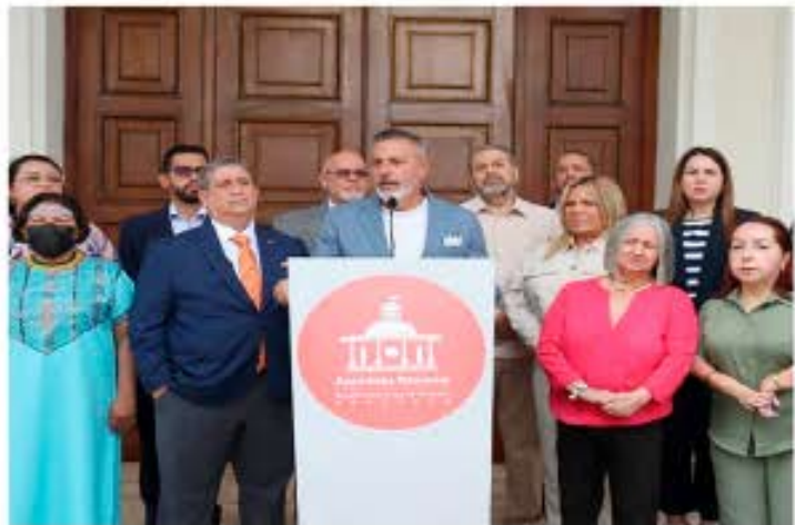
Se espera que el proceso de evaluación sea riguroso y transparente

Por otro lado, se espera que el proceso de evaluación sea riguroso y transparente, para garantizar que los seleccionados cumplan con los requisitos establecidos y posean la experiencia y capacidad para desempeñar estos cargos.