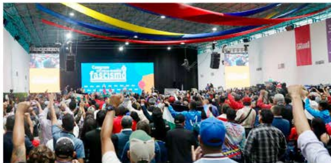
Este foro de discusión contará con la participación de más de 300 legisladores de más de 70 países

"Decimos con respeto, pero con firmeza, que no solo hemos logrado detener el fascismo en Venezuela, sino que nos encontramos con más determinación y fuerza que nos da el pueblo para enfrentar cualquier acción ajena a nuestra Constitución, de aquellos que intenten aquí la destrucción con la cara del fascismo", aseveró.