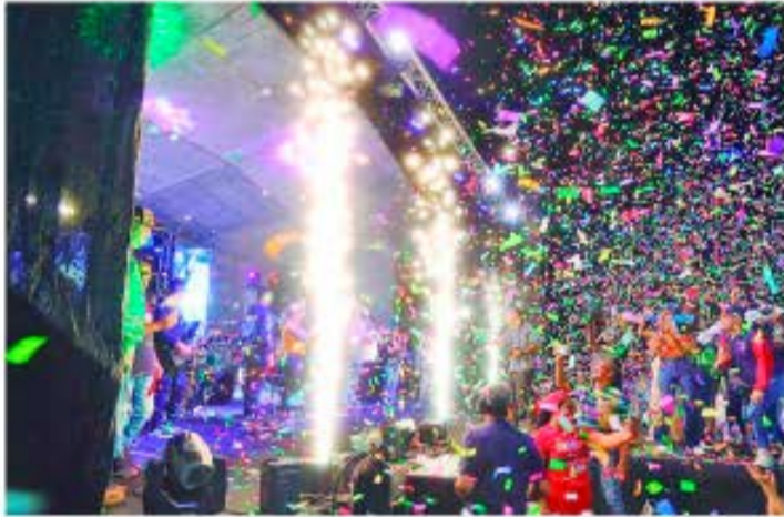
IRENE RODRÍGUEZ | CIUDAD MCY FOTO | CORTESÍA

> El Gobierno regional, en aras de celebrar y promover la cultura en estos Carnavales Felices y Seguros Aragua 2025, motorizó el show con buena música en vivo para el disfrute de propios y visitantes