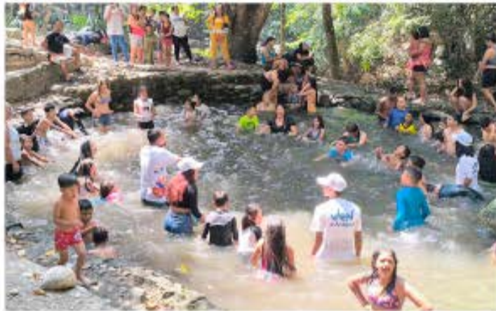
THAMARA ORTIZ | CIUDAD MCY FOTO | CIUDAD MCY

> Dos puntos de alto impacto, como lo son el Zoológico de Las Delicias y el Área Recreacional "Las Cocuizas" se convierten en sitios predilectos para los vacacionistas en estas zafras