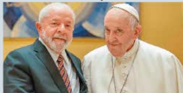
El presidente Luiz Inácio Lula da Silva anunció un período de siete días de luto oficial en Brasil

El mandatario recordó los encuentros que sostuvo con el Papa, donde compartieron visio-