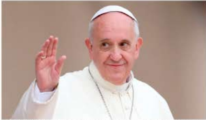
El traslado de Francisco a la basílica desde la capilla de la Casa Santa Marta, donde residió en vida