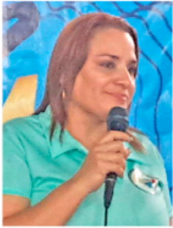
CIUDAD MCY | PRENSA OVAM FOTOS | CORTESÍA

El Fórum de la Universidad Bicentennial de Aragua fue el escenario perfecto para la celebración del torneo de kenpo "Batalla de Guerreros", evento que reunió a los atletas más destacados de este arte marcial provenientes de 10 estados del país.