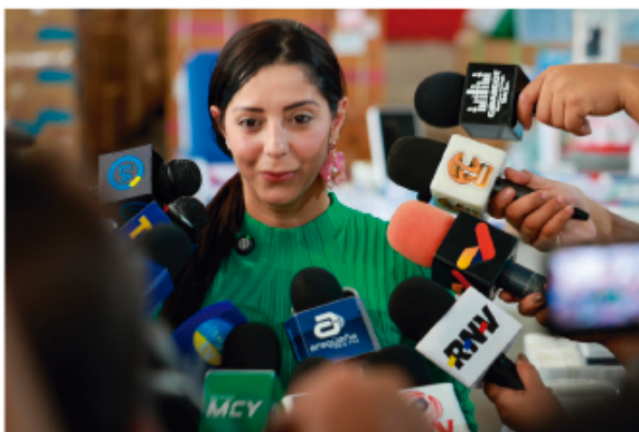
THAIMARA ORTIZ | CIUDAD MCY FOTOS | CORTESÍA

> Más de 10 centros de atención recibieron diversos medicamentos, entre los que se encuentran antipiréticos, antibióticos, anestésicos, soluciones inhalatorias, antiparasitarios, soluciones fisiológicas, soluciones glucosadas y materiales para asepsia y antisepsia