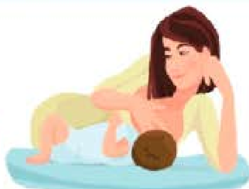
RECOSTADA DE LADO