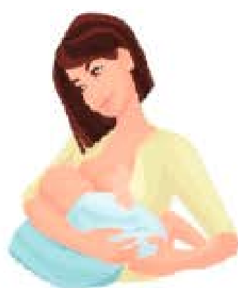
POSICIÓN DE CUNA