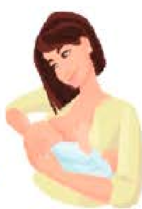
POSICIÓN DE CUNA EN CRUZ