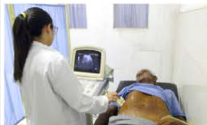
CIUDAD MCY | PRENSA CORPOSALUD FOTOS | PRENSA CORPOSALUD

Con éxito se llevó a cabo una nueva Jornada de Atención Especializada en Salud destinada a los trabajadores del Mercado Mayorista del estado Aragua, con más de 200 personas atendidas, en pro de garantizar el bienestar físico a todos y todas por igual.