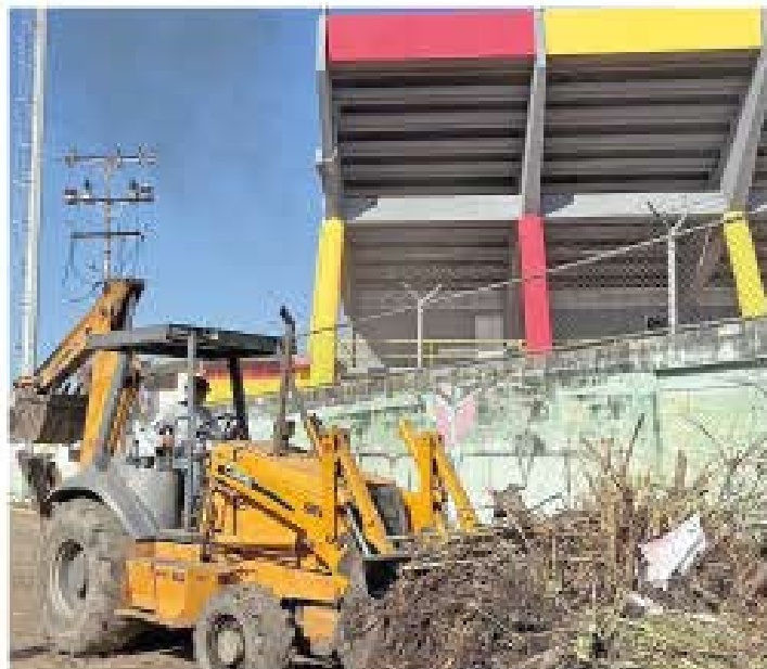
YORBER ALVARADO | CIUDADMCY FOTO | CORTESÍA

> Es importante mencionar que esta iniciativa está enmarcada en el Plan de la Araguañidad, que no solo transforma la infraestructura, sino que también garantiza el apoyo logístico y el resurgimiento de disciplinas que lograrán posicionar a la entidad como referencia deportiva