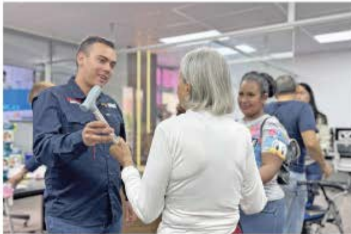
CIUDAD MCY | PRENSA GBA FOTOS | PRENSA GBA

> Esta acción, que se enmarca en la 4T del Plan de la Patria de las 7 Transformaciones y el Plan de la Aragüenidad, favoreció a vecinos de cuatro municipios de la región