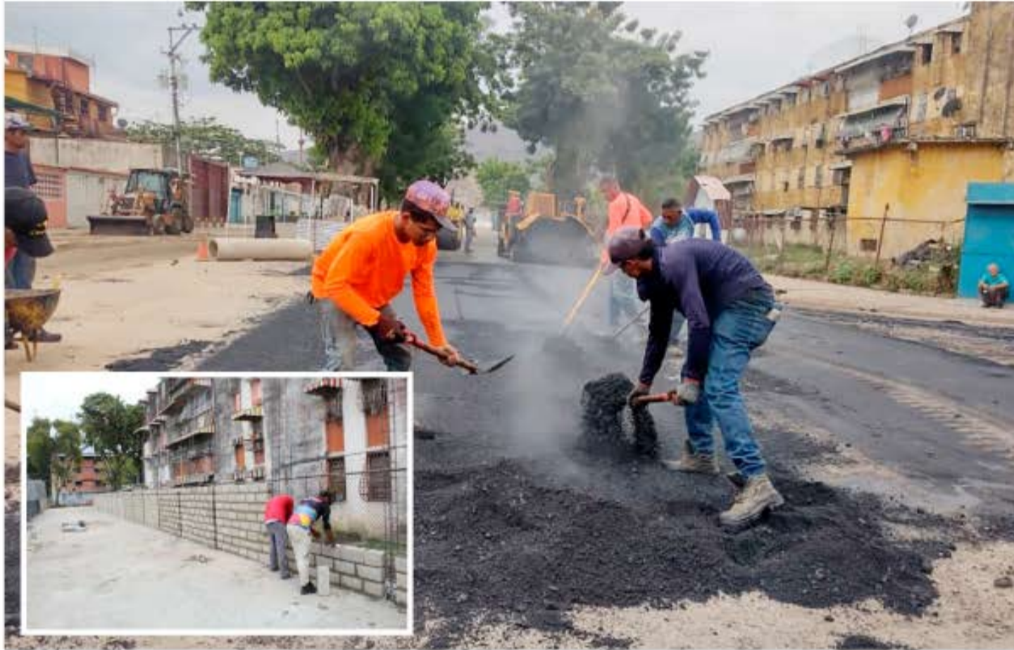
ELIMAR PÉREZ CIUDAD MCY FOTOS | CORTEÍA

“Estos trabajos se llevan a cabo conjuntamente con los entes que conforman el Gobierno de Aragua: Costaragua, Vías de Aragua, Fundaragua, Aramica, Fundaparques y los ministerios, todos como un solo gobierno”, finalizó Ramírez.