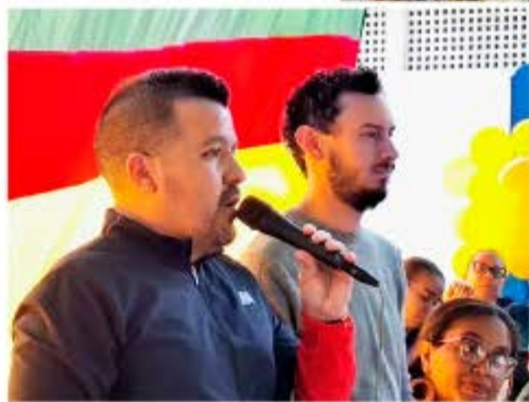
YORBER ALVARADO | CIUDADMCY FOTOS | CORTESIA

Cabe destacar que, estas acciones forman parte del empoderamiento del Poder Popular que, gracias a las políticas públicas del Gobierno Bolivariano, ha asumido un rol protagónico desde sus comunidades.