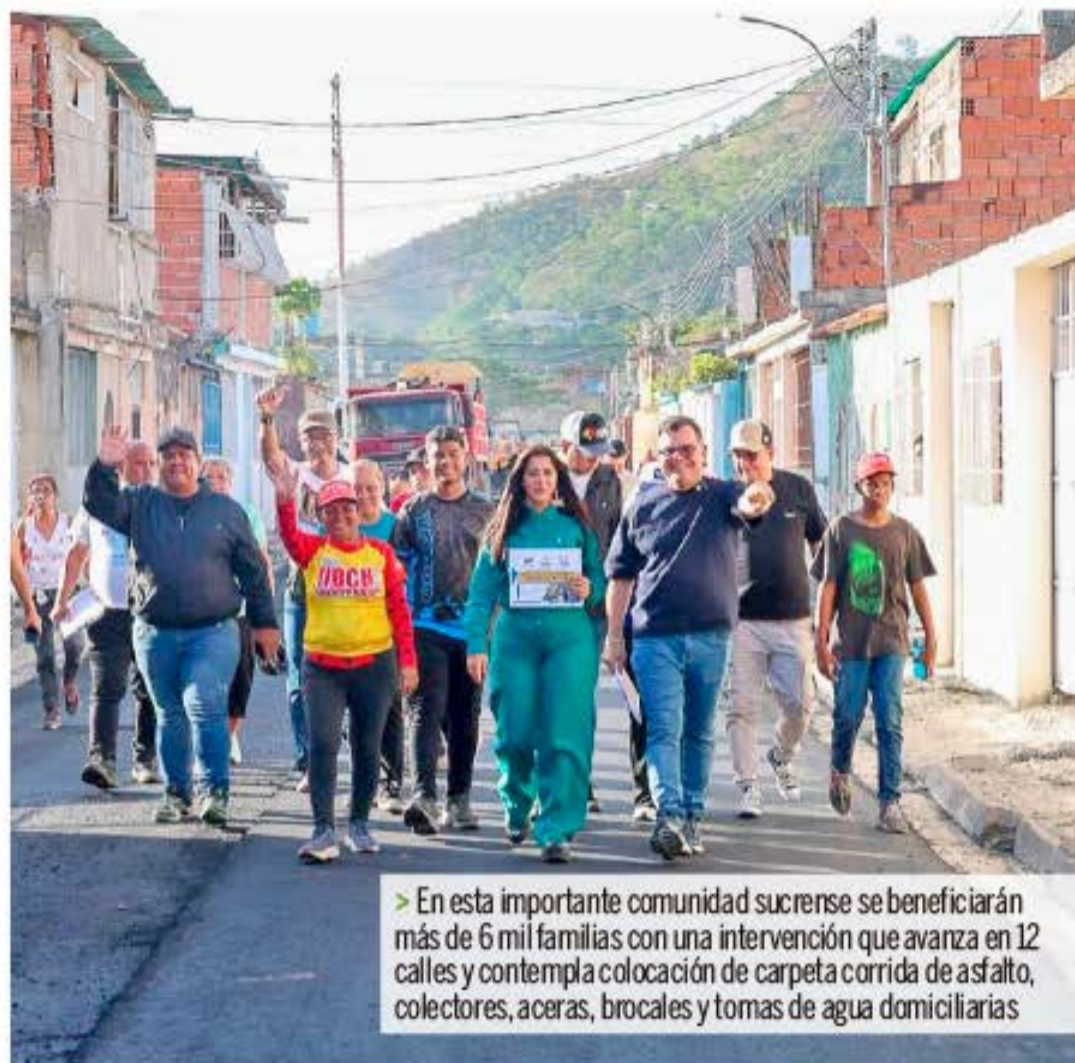
> En esta importante comunidad sucreña se beneficiarán más de 6 mil familias con una intervención que avanza en 12 calles y contempla colocación de carpeta corrida de asfalto, colectores, aceras, brocales y tomas de agua domiciliarias