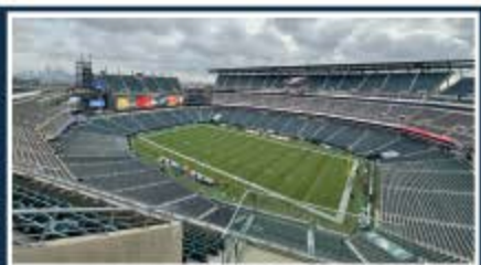
Filadelfia / Lincoln Financial Field Capacidad: 69.596