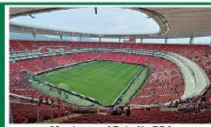
Monterrey / Estadio BBA Capacidad: 53.500