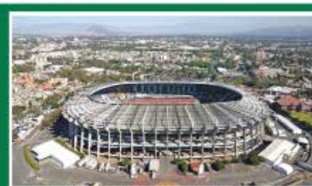
Ciudad de México / Estadio Azteca Capacidad: 83.264