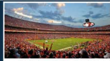
Kansas City / Arrowhead Stadium Capacidad: 76.416