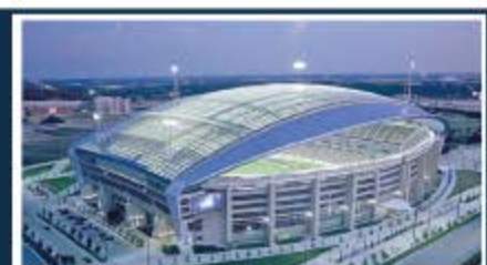
Dallas / AT&T Stadium Capacidad: 80.000