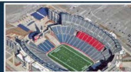
Boston / Gillette Stadium Capacidad: 65.878