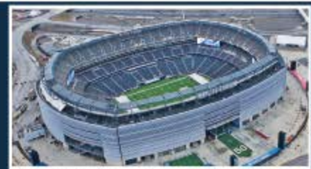
Nueva York - Nueva Jersey / MetLife Stadium Capacidad: 83.500