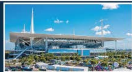
Miami / Hard Rock Stadium Capacidad: 75.540