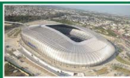
Guadalajara / Estadio Akron Capacidad: 46.355