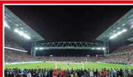
Toronto / BMO Field Capacidad: 30.000