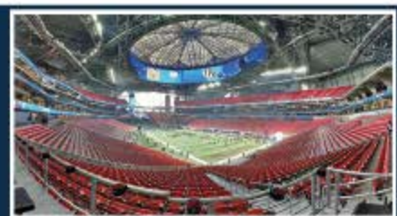
Atlanta / Mercedes-Benz Stadium Capacidad: 71.000