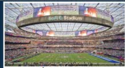
Los Ángeles / SoFi Stadium Capacidad: 70.000