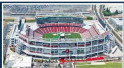
San Francisco / Levi's Stadium Capacidad: 68.500