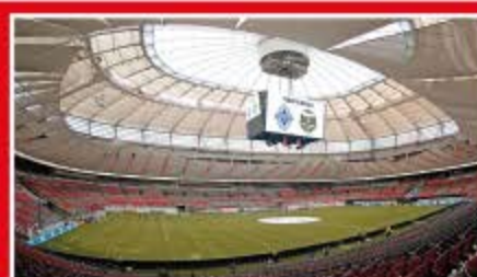
Vancouver / BC Place Vancouver Capacidad: 54.500