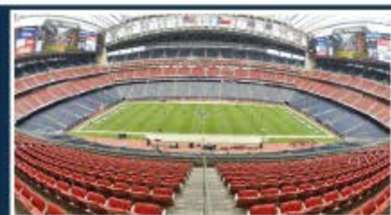
Houston / NRG Stadium Capacidad: 71.795