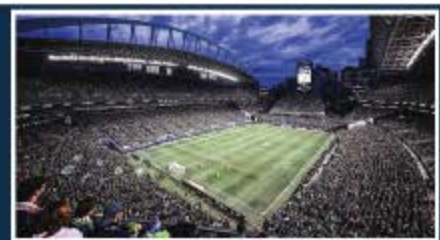
Seattle / Lumen Field Capacidad: 68.740